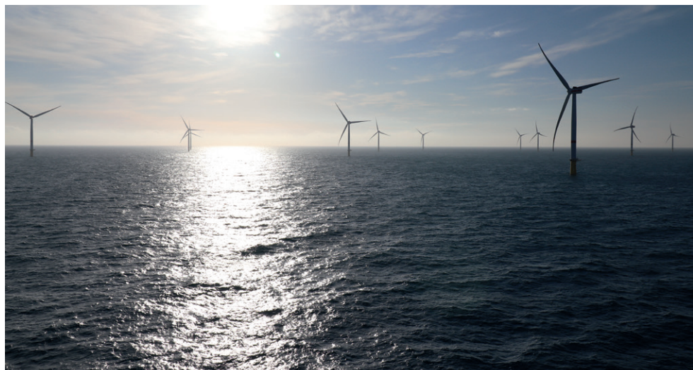
Beteiligung der KGAL an Veja Mate, dem zweitgrößten Offshore-Windpark Deutschlands