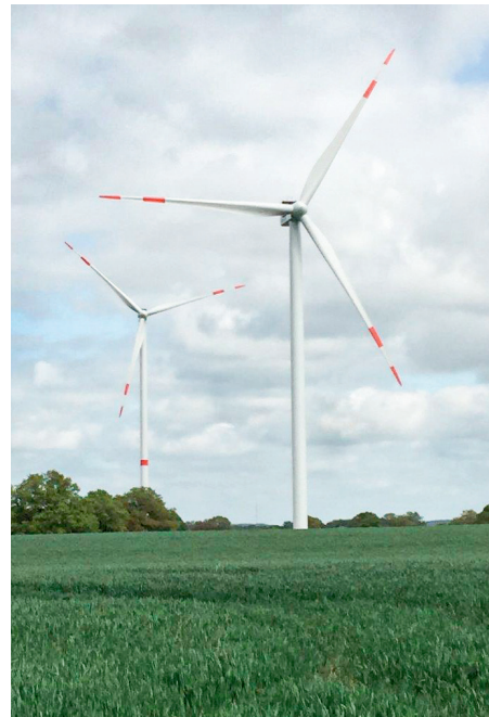
In unserem Windpark Kastorf in Schleswig-Holstein haben wir nachteilige Auswirkungen auf die direkte Umgebung deutlich reduziert.