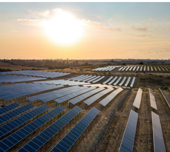
Solarpark der KGAL auf Sardinien

Um den Bedarf an erneuerbaren Energien in Polen weiter zu unterstützen und die Nachfrage nach grüner Energie zu nutzen, hat KGAL außerdem ein Joint Venture mit dem polnischen Projektentwickler Lasuno für den KGAL ESPF 5 Impact Fund gegründet, um vier Solarparks mit einer Gesamtkapazität von mehr als 200 Megawatt (MW) zu entwickeln. Die Pipeline soll in den kommenden Jahren um weitere Solar- und Windprojekte erweitert werden. Die ersten Solarparks sollen bis Ende 2025 den Status Ready-to-Build (RTB) erreichen.